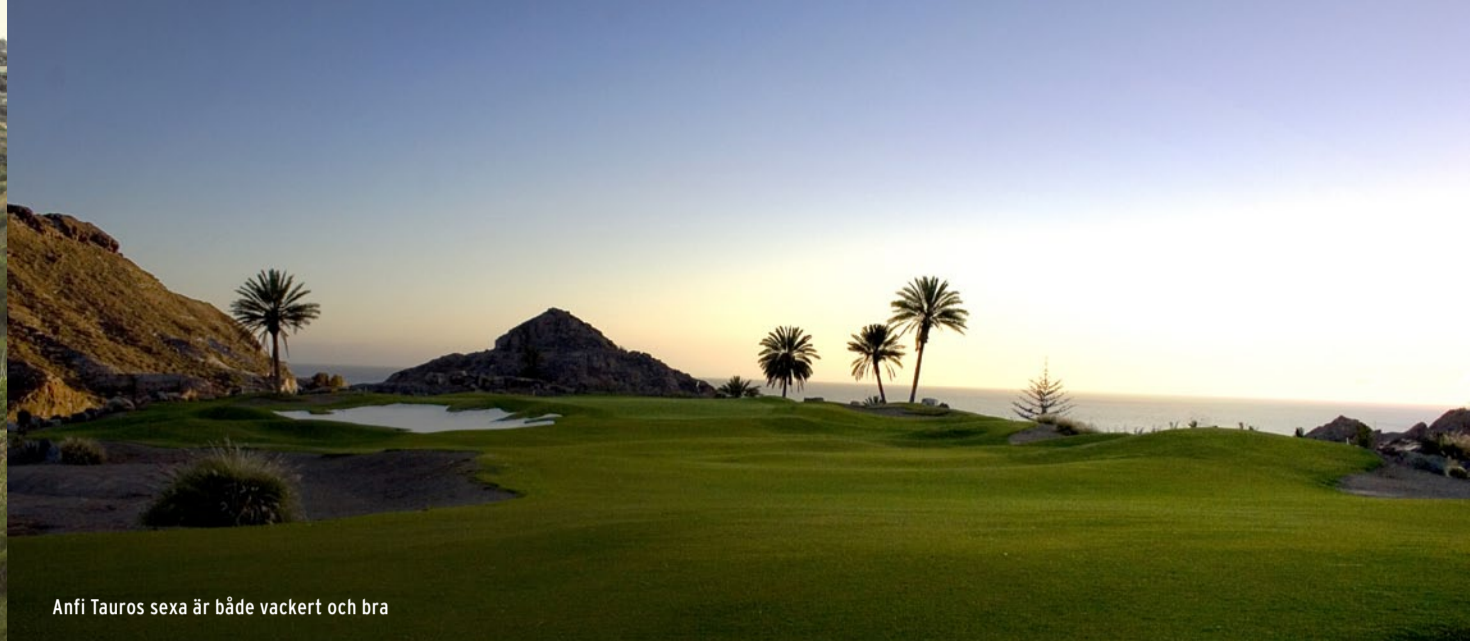
Anfi Tauros sexa är både vackert och bra