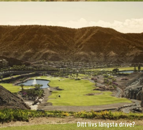
Ditt livs längsta drive?

» nedför i varierande grad. Ravinerna och vulkanlandskapet i kombination med de hisnande vyerna gör att man ibland får svårt att fokusera på de spännande golfhålarna där man ofta bör tänka till lite innan man väljer klubba och spellinje.