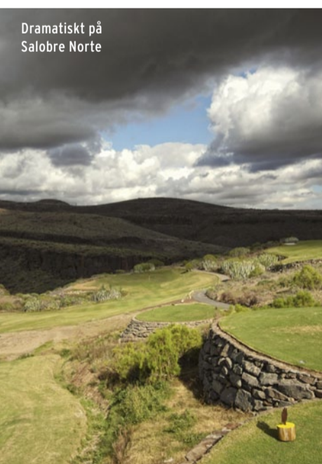
Dramatiskt på Salobre Norte