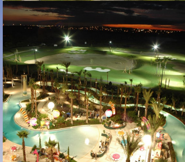
ChampionsGate har en elupplyst kort-hålsbana för den som vill fortsätta spela när mörkret lagt sig.