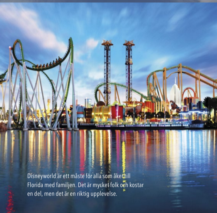
Disneyworld är ett måste för alla som åker till Florida med familjen. Det är mycket folk och kostar en del, men det är en riktig upplevelse.

De många vackra miljöerna kompletterar de fina golfhålen väl och med snabba och jämna greener är det en ren fröjd att ta sig an den strategiska layouten. Mot slutet av rundan finns några riktigt fräcka hål och kan man ta sig förbi de sista fyra med en bra score har man gjort bra ifrån sig. Och det är kanske lite skrytigt, men undertecknad nådde sista hålet på två slag och fick så när i eagleputten.