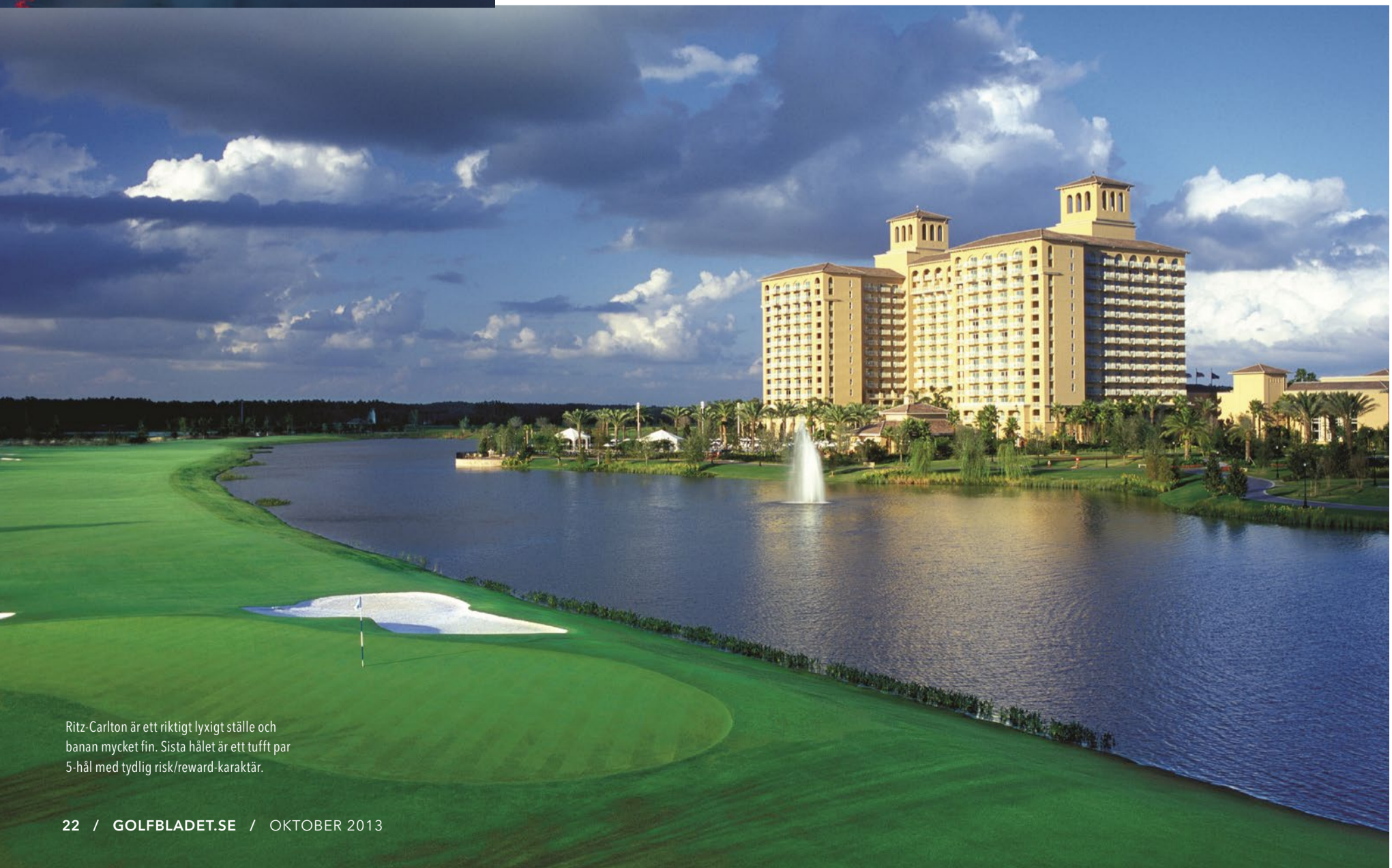
Ritz-Carlton är ett riktigt lyxigt ställe och banan mycket fin. Sista hålet är ett tufft par 5-hål med tydlig risk/reward-karaktär.

Om du också vill njuta av värme, enorma bilar, mat som aldrig hört talas om nyckelhålmärkning och fina golfbanor så finns flera arrangörer som ordnar resor till Florida om du inte själv vill pyssla med alla detaljer. Orlando är också bara en av många destinationer i Florida som är värda ett besök.